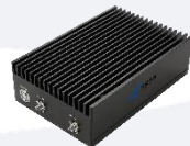
Available 220V System Benchtop Amplifier