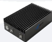
Available 220V System Benchtop Amplifier