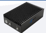
Available 220V System Benchtop Amplifier