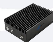
Available 220V System Benchtop Amplifier