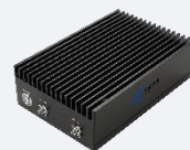
Available 220V System Benchtop Amplifier